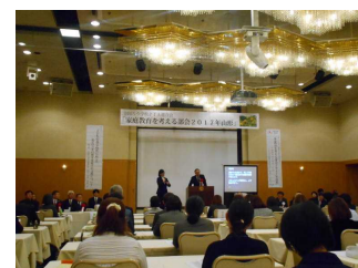
施：ホテルキャッスル(山形)