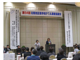
施：イタリア軒(新潟)