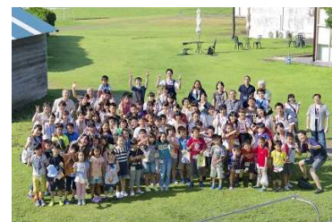
施：三浦ふれあいの村(神奈川県)

開催内容 日頃、外出が難しい病虚弱児及び家族に対し、専門の医師等がスタッフとしてサポートし、磯遊びや野外活動、室内運動会等のレクリエーションと共に動作訓練等の指導も行われました。