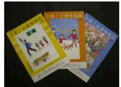
子育て支援情報誌