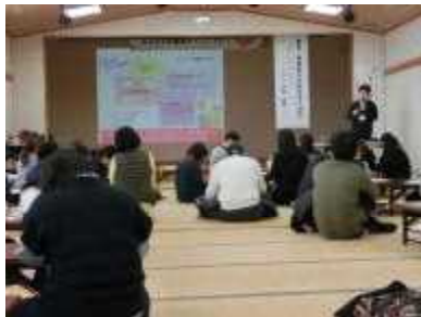
園内研修会(福岡県)

開催内容 全国にある幼稚園・保育園の中で、2 地域を指定し、医療・福祉・教育等の専門家チームによる訪問活動を実施するとともに、園の教職員に対し発達障害児に対する専門性向上の為の研修会を併せて開催しました。また達障害に関わる「子育て支援情報誌」を作成し、関係機関に無料配布しました。