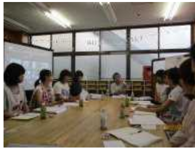
訪問支援活動(山口県)